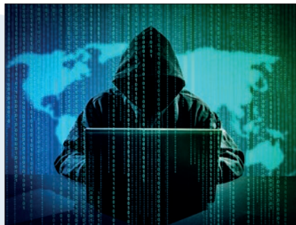
Cyberkriminelle am Werk

Experten zufolge nutzen Cyberkriminelle gezielt Sicherheitslücken aus und installieren Schadsoftware, um ganze IT-Systeme anzugreifen.